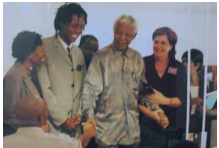
Nelson Mandela honours Imfundiso as an initiative against poverty and unemployment.