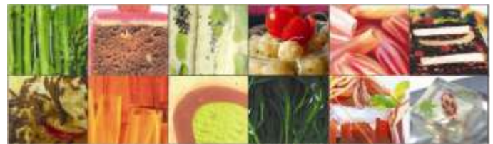
Skizze einer Transkulturelle Tischlandschaft O-Japan 09, KulturAXE

vereinte. Es folgte unsere Ausstellung DIAGONALE (1991) in der Galerie der Stadt Bratislava im Palais Mirbach. Seit 1991 veranstalteten wir auch Sommersymposien in der Slowakei von Moravany bis Topolcianky. 1995 gründeten wir schließlich die KulturAXE um die Aktivitäten auf Vereinsbasis fortsetzen zu können. Demnach gibt es uns seit 14 Jahren als Verein —