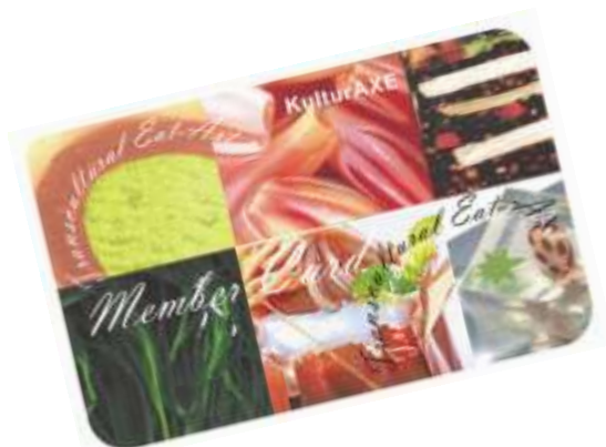
KulturAXE member card 09—macht Appetit !

Vermittlung & Beratung (Kontakte); Ermäßigung auf alle KulturAXE Angebote; Einladungen, Informationsvermittlungen; Bekanntmachung eigener Aktivitäten; Nutzung des Ateliers KulturAXE zur „ Freundschaftspauschale “; Teilnahmemöglichkeit an geförderten Workshops unserer Partner; Teilnahme an der Mitglieder Jahres-Ausstellung im Atelier KulturAXE, u.v.m. Mitgliedsgebühr: € 40 (1 Jahr ab Beitritt) Detaillierte Infos & Beitrittsformular auf www.kulturaxe.com (MEMBERS).